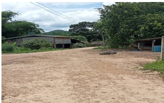
รูปก่อนดำเนินงาน