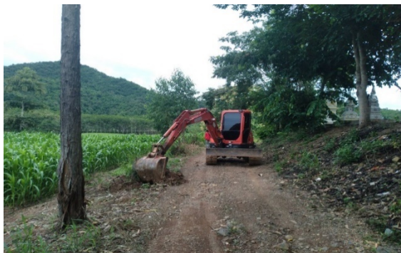
รูปขณะดำเนินงาน