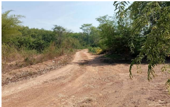
รูปก่อนดำเนินงาน