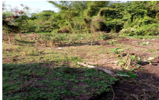
รูปขณะดำเนินงาน