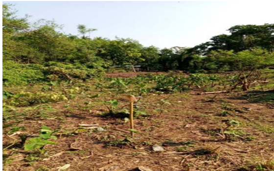
รูปก่อนดำเนินงาน