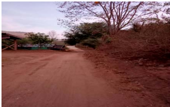
รูปก่อนดำเนินงาน