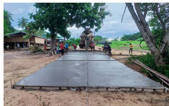
รูปดำเนินงานแล้วเสร็จ