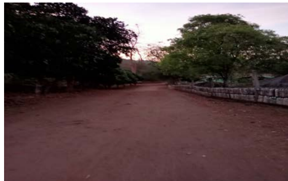
รูปขณะดำเนินงาน