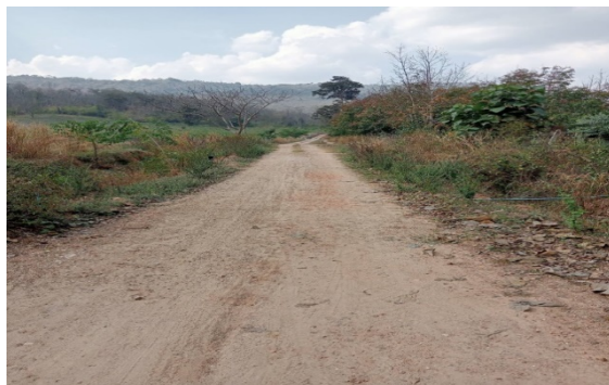
รูปก่อนดำเนินงาน