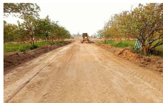
รูปดำเนินงานแล้วเสร็จ